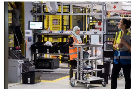
Dans un centre de distribution d'Amazon, à Bretigny (Essonne), le 22 octobre 2019.