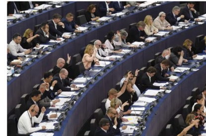
Des députés lors d'une session du Parlement européen, à Strasbourg, le 8 juin 2022.